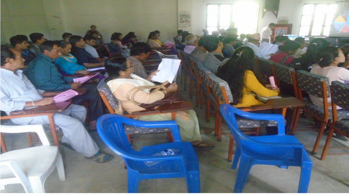
२. वार्षिक समीक्षामा कार्यक्रममा उपस्थित सहभागीहरु