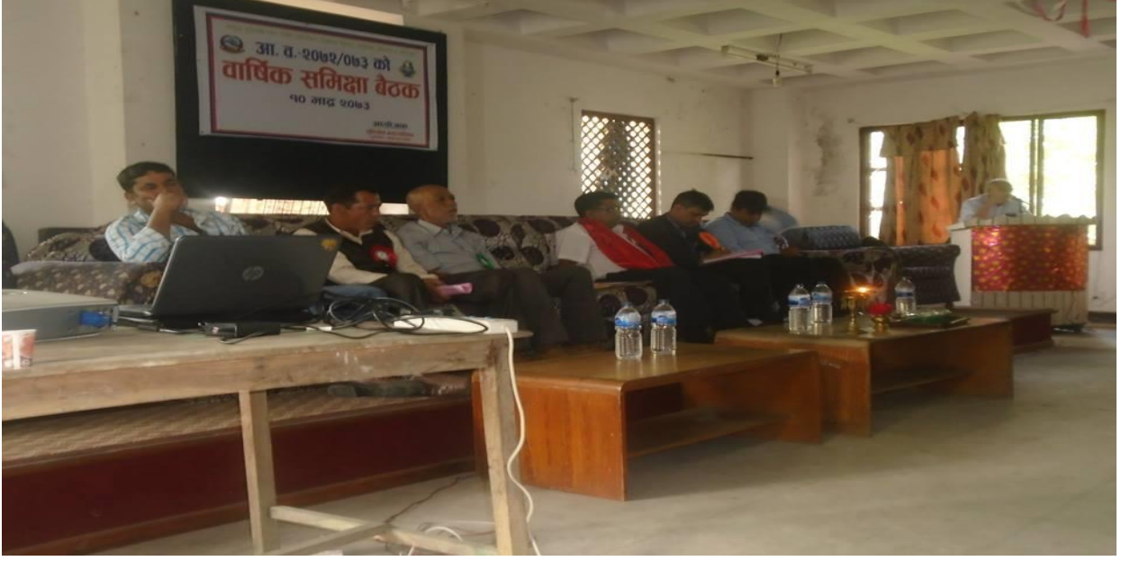
१. वार्षिक समीक्षामा उपस्थित अतिथी महानुभावहरु